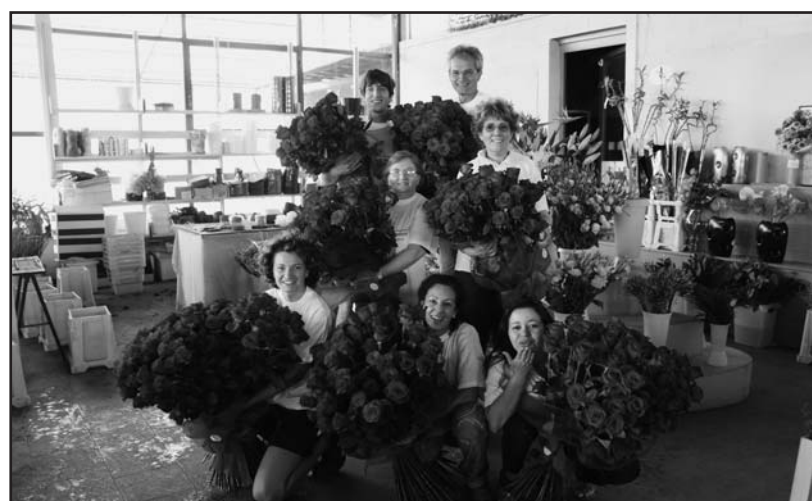
L'organizzazione del Garden Shop pronta per la consegna delle 700 rose rosse.

Immaginatevi la faccia della "amata" nel vedersi recapita-