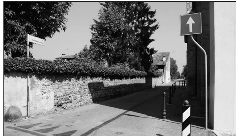
Il tratto di strada oggetto della discordia.

Prima del Palio degli Asini, avvenimento storico che vede la popolosa frazione vivere giornate molto intense, è giunta la SOSPENSIONE, da parte del TAR, del provvedimento di chiusura della strada, in attesa della risposta definitiva.