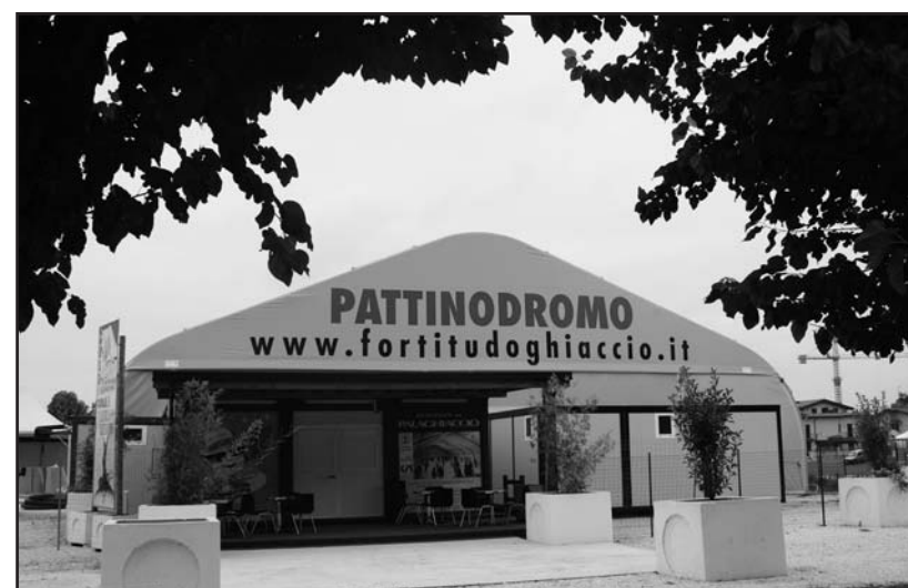
L'entrata del nuovo palazzetto del ghiaccio a Castenedolo.

Associata all'Unione Stampa Periodica Italiana