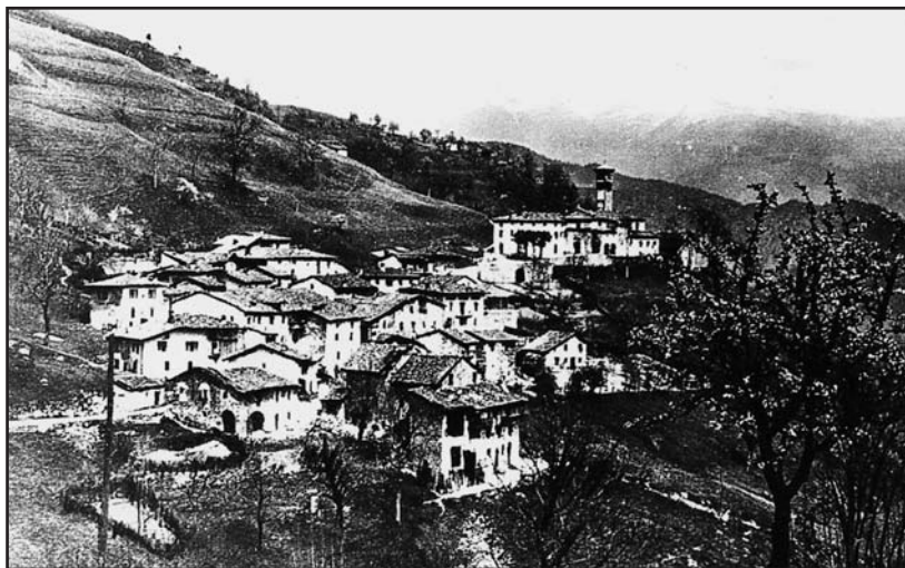
Pezzoro incontaminato in una fotografia degli anni '50 (dal libro L'uomo e lo sci dello Sci Club Pezzoro, 1992 ).