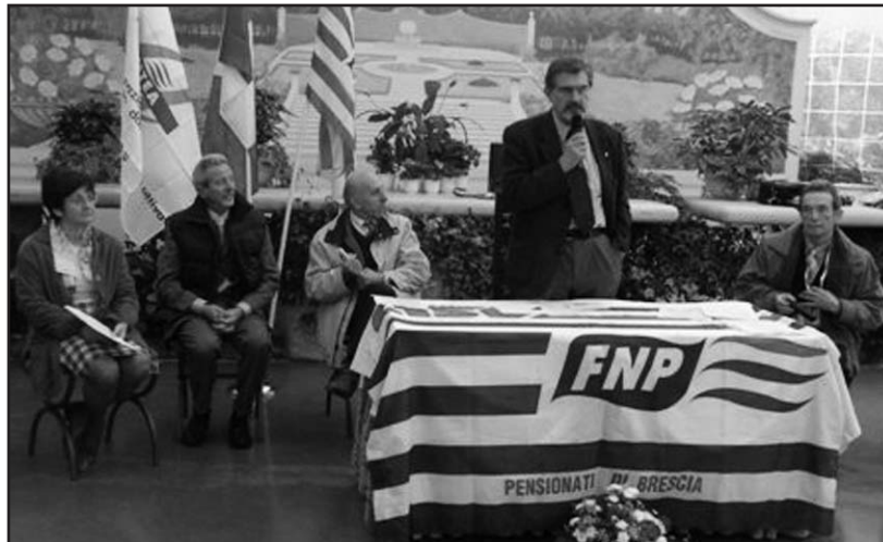
L'incontro di un anno fa.

L'appuntamento è per mercoledì 29 settembre, quale sa-